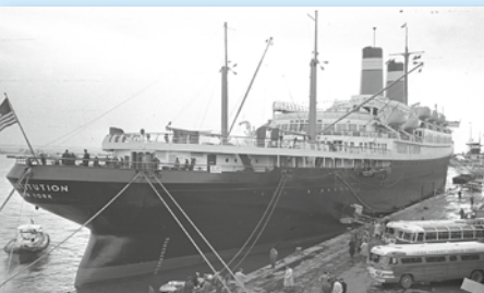
Die Constitution 1953 in Haifa.

Die Constitution wurde im Liniendienst zwischen New York und Genua bzw. Neapel in Italien eingesetzt. In den späteren Jahren kamen zeitweise Kreuzfahrten hinzu. Auf der Reise zur Abwrackwerft sank das Schiff am 17. November 1997 nördlich von Hawaii.