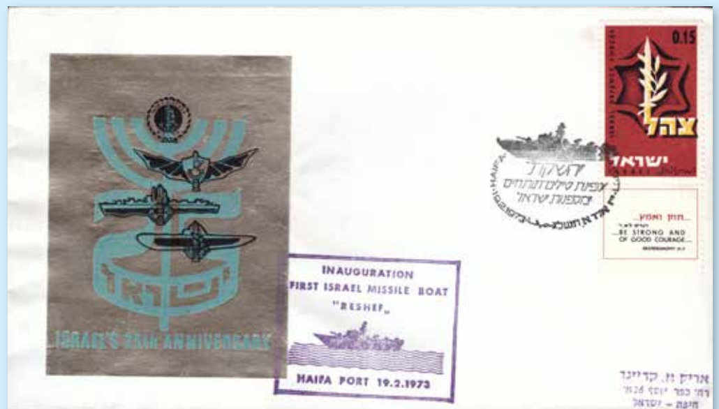
25 Jahre Israel. Kastenstempel mit Text: Indienststellung des ersten israelischen Raketenschnellbootes Reshef in Haifa am 19.02.1973