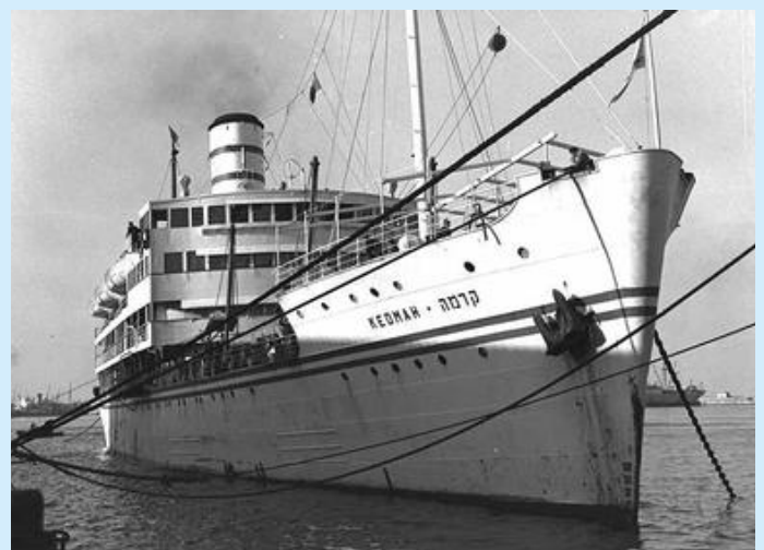
Die SS Kedmah trug als erstes Passagierschiff die israelische Flagge.