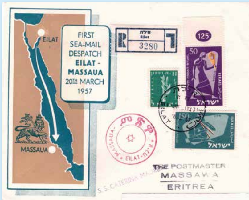
Briefumschlag mit dem Hinweis auf die erste Seepost von Israel nach Äthiopien an Bord der SS Catherina Madre über den Rotmeerhafen Massawa (heute in Eritrea) und mit Stempeln aus Tel Aviv/Jaffa, Eilat am 20. März 1957 und Addis Abeba am 25. April 1957

Als Jerusalem fuhr das Schiff von Israel nach New York und konnte dabei 38 Passagiere der Ersten Klasse und 741 der Dritten Klasse transportieren. Außerdem absolvierte sie elf Überfahrten von Haifa nach Nordamerika. 1957 wurde sie auf die Route Israel – Marseille gesetzt und in Aliya umbenannt. 1959 wurde das 46 Jahre alte Schiff zum Abbruch nach Italien verkauft und auf der Abwrackwerft in La Spezia abgewrackt.