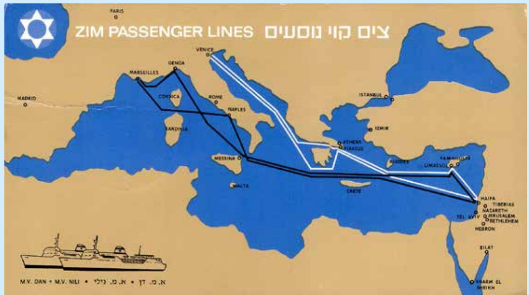
Fährdienst im Mittelmeer mit der ZIM im Linienverkehr in den 1970er Jahren.

Die 1945 gegründete Reederei ZIM wurde 1948 zur nationalen Reederei. Um Fracht und Passagiere abzufertigen, wurde 1961 die Israel Port Authority gegründet. Seit 1959 ist die Werft Israel Shipyards in Haifa aktiv, welche sowohl die zivile Handelsflotte unterstützt als auch Korvetten und Schnellboote für die Marine baut.