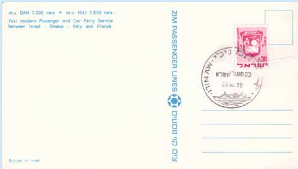
Ersttagsbrief der MV Nili mit Sonderstempel vom 23.10.1970 (Rückseite der Postkarte im Titel).