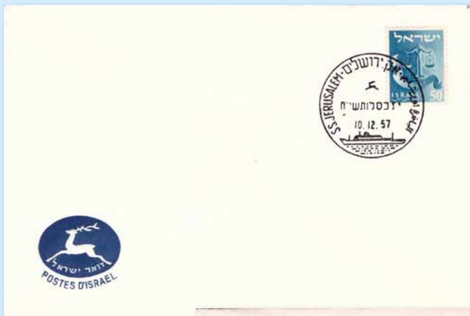
Ersttagsbrief der SS Jerusalem II mit Sonderstempel vom 10.12.1957.

Die SS Theodor Herzl wurde im Rahmen des Londoner Schuldenabkommens für die israelische Reederei ZIM bei der Deutschen Werft in Hamburg gebaut, 1957 abgeliefert und bis 1965 im Liniendienst zwischen Limassol, Piräus, Venedig und Haifa eingesetzt. Ab 1965 machte die Theodor Herzl ausschließlich Kreuzfahrten, bis sie 1969 verkauft, in Carnivale umbenannt und als schwimmendes Hotel genutzt wurde.