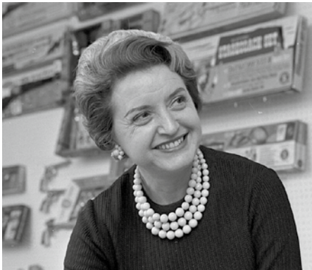
Ruth Handler um 1961.

Im Jahr 1959 stellten Mattel-Gründer Ruth und Elliot Handler die heute wohl berühmteste Puppe der Welt vor