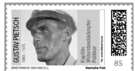
Entwurf einer Briefmarke Individuell als Ehrung für einen mutigen Mann.

In Gdynia sass 1935 eine Gruppe der zionistischen Jugendorganisation „Gordonia“ aus Polen, etwa sechzig