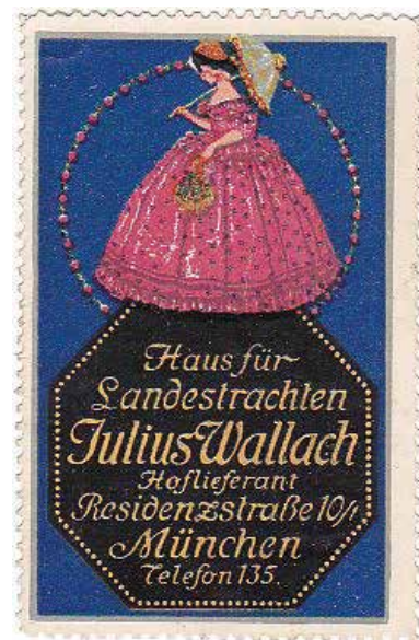
Reklamemarke um 1920

Die Machtübernahme der Nationalsozialisten 1933 wirkt sich nicht negativ auf das florierende Geschäft aus. Dirndl und Trachtenjacken sind ebenso gefragt wie die typischen, mit Trachtenpaaren, Fachwerkhäusern, Waldtieren und schwebenden Landschaften bedruckten Wallach-Stoffe. Göring und Hitler gefallen die Erzeugnisse, nichtsdestotrotz wird der Firmeninhaber zunehmend antisemitischen Angriffen ausgesetzt. Im August 1938 wird Moritz Wallach gezwungen, das Unternehmen zu verkaufen und am 17. November 1938, sechs Tage nach den Pogromen der sogenannten Kristallnacht, beschlagnahmten Gestapo-Beamte in Begleitung von SS und SD mit zwei Kunstsachverständigen „deutsches Kulturgut“. Im Frühjahr 1939 reist das