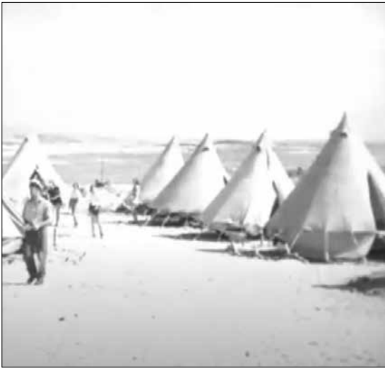
Das „Dorf“ bei Athlit besteht 1939 noch aus Zelten.

junge Leute und junge Mädchen, die als Chaluzim nach Palästina wollten und die „Eroberung des Meeres“ auf ihre Fahne geschrieben hatten. Sie arbeiteten unter härtesten Bedingungen im Hafen von Gdynia – die Mädchen in den Fischhallen und in den Fischkonserven-Fabriken, die Jungens als Stauer, Lastträger, Schauerleute. Aber es war nicht das Rechte, denn eigentlich wollten sie Fischer werden. Da führte die Vorsehung ihnen Käpt´n Pietsch in den Weg. Der dachte an seine jüdischen Kriegsoffer-Kameraden in Danzig ... und an einiges mehr, was in Deutschland den Juden geschehen war. Er meinte, da sei einiges wieder gutzumachen; nur sich schämen, sei nicht genug. Und der rassenreine pommersche Arier ging zu den jungen polnischen Juden und sagte: „Kommt her, ich werde Fischer aus Euch machen!“