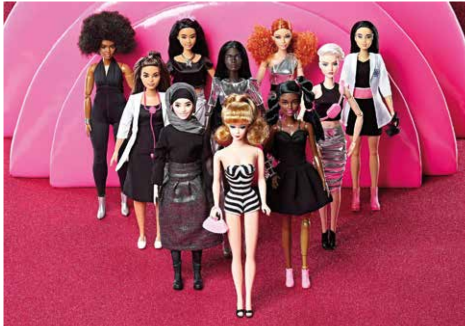
Barbie ist heute nicht nur blond, sondern stellt viele Ethnien und auch Behinderte dar.