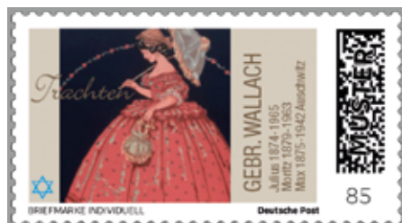
Entwurf einer Briefmarke Individuell zur Erinnerung an die Gebrüder Wallach.

Das erste Dirndl aus Seide entsteht aus einem aus dem Brixental mitgebrachten Trachtenkostüm. Eine preußische Prinzessin trägt es auf einem Ball in Paris und erregt damit großes Aufsehen. Tracht wurde von Städtern