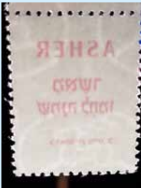
Marke aus der Serie „Stämme Israels“ mit dem Wasserzeichen „Hirsch 5“ im Oval, springender Hirsch nach links.

Die israelische Post hat in den ersten fünf Jahren ihres Bestehens auf Wasserzeichenpapier verzichtet. Erst am 3. August 1953 (Maimonides) erschien die erste Sondermarke auf Papier mit Wasserzeichen. In den folgenden Jahren verwendete die israelische Post zwei verschiedene Sorten Wasserzeichenpapier, allerdings nicht regelmäßig. Denn auch in dieser Zeit wurden immer wieder Ausgaben an die Schalter gebracht, die auf wasserzeichenlosem Papier gedruckt worden waren. Seit Mitte 1960