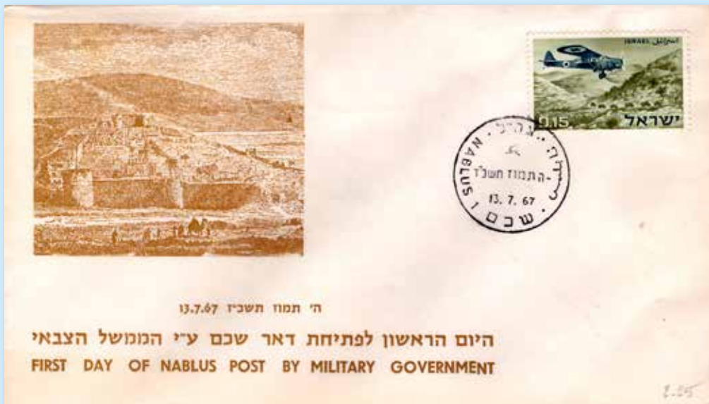
Erinnerungsbrief an die Eröffnung des israelischen Postamts in Nablus (Westjordanland) unter militärischer Verwaltung, dreisprachiger Stempel Nablus vom 13. Juli 1967.