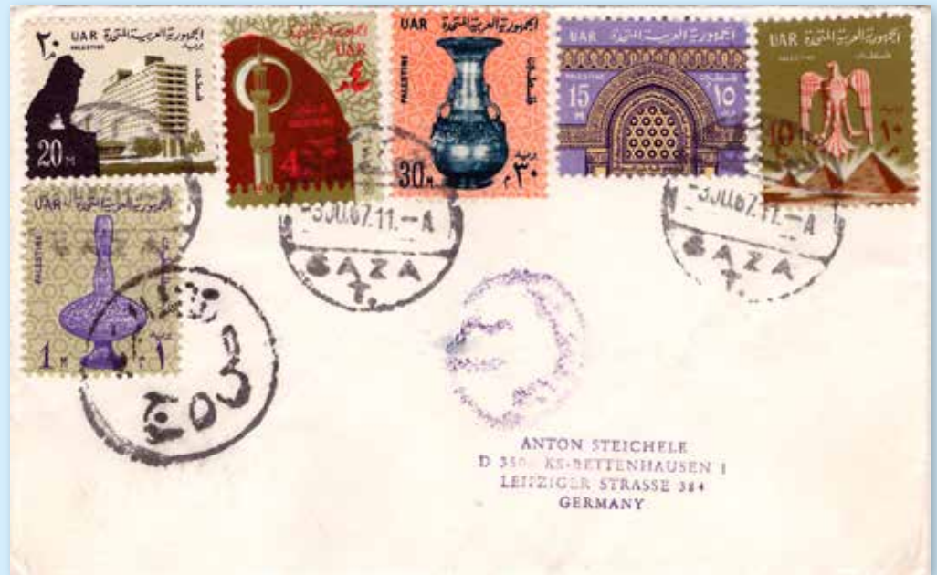
Brief aus dem ägyptisch besetzten Gaza vom 3.6.67 (drei Tage vor der israelischen Besetzung) an Anton Steichele, dem Autor vieler Artikel für die ehemalige Bundesarbeitsgemeinschaft Israel im BDP.