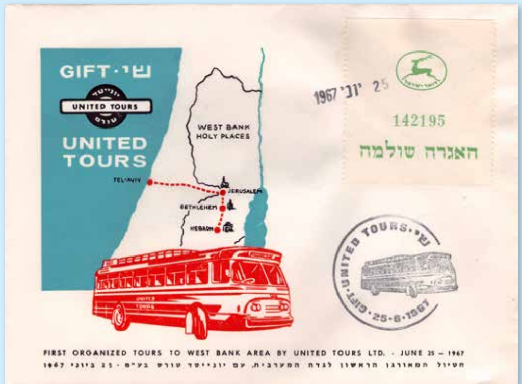
Schon wenige Tage nach dem Krieg wurden organisierte Busreisen in das besetzte Westjordanland zu den heiligen Stätten angeboten. Nummeriertes Freimachungs-Etikett der Israel Post, Datumsstempel und Privatstempel mit Reisedatum.