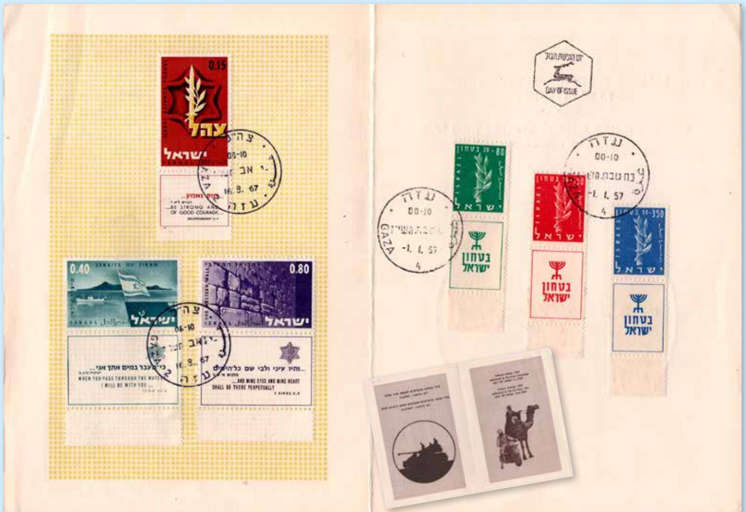
Souvenir-Faltblatt mit den „Verteidigungsmarken“ aus dem Jahr 1957 mit dem Ersttagsstempel Gaza vom 1.1.57. Auf der linken Seite die Sondermarken zum Erfolg im Sechstagekrieg mit dem Ersttagsstempel Gaza 2 vom 16.8.67. Titel und Rückseite siehe kleines Bild.