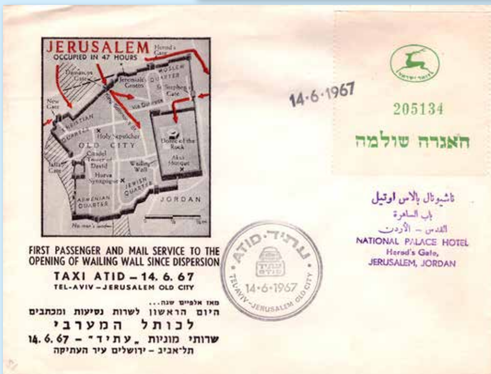
Erste Taxipost und Postservice mit der Privatfirma TAXI ADID ab 14. Juni 1967 in die Altstadt von Jerusalem und an die Klagemauer. Nummeriertes Freimachungs-Etikett der Israel Post, Datumsstempel 14.6.67 und Privatstempel mit Reisedatum. Anschriftstempel des National Palace Hotels in Jerusalem.