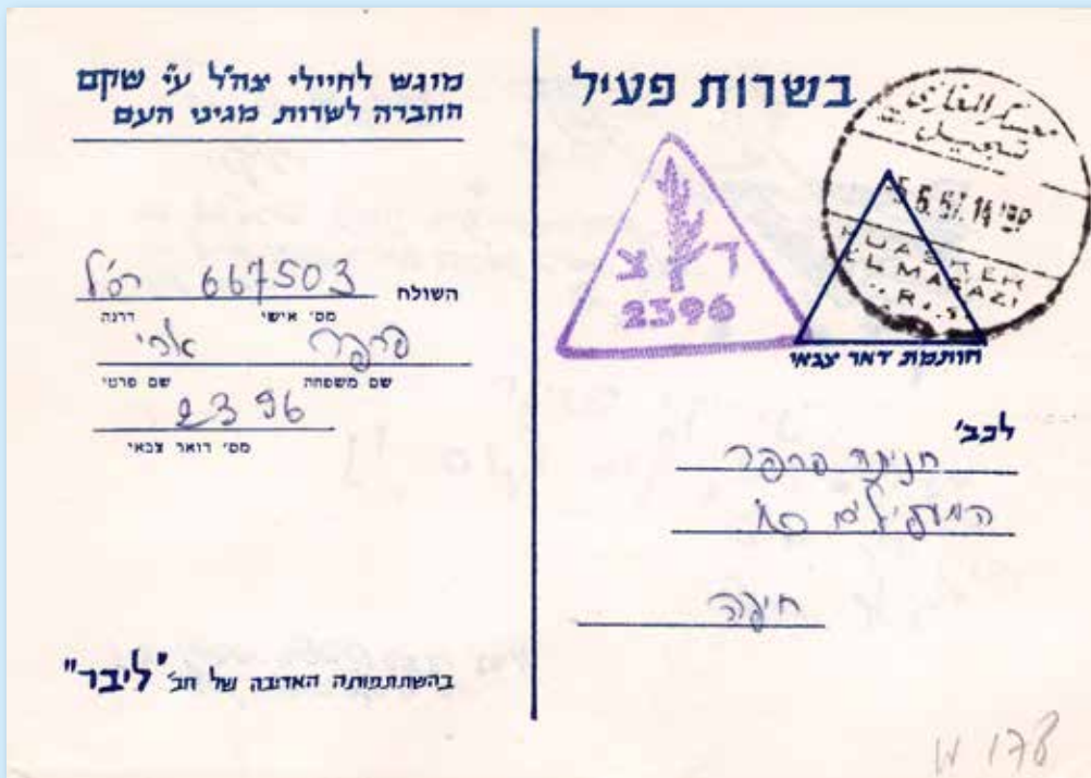
Diese Bildpostkarten sollten die Moral der israelischen Soldaten stärken und wurden für kurze Grüße an die Angehörigen eingesetzt. Stempel vom ersten Tag des sechs Tage andauernden Krieges