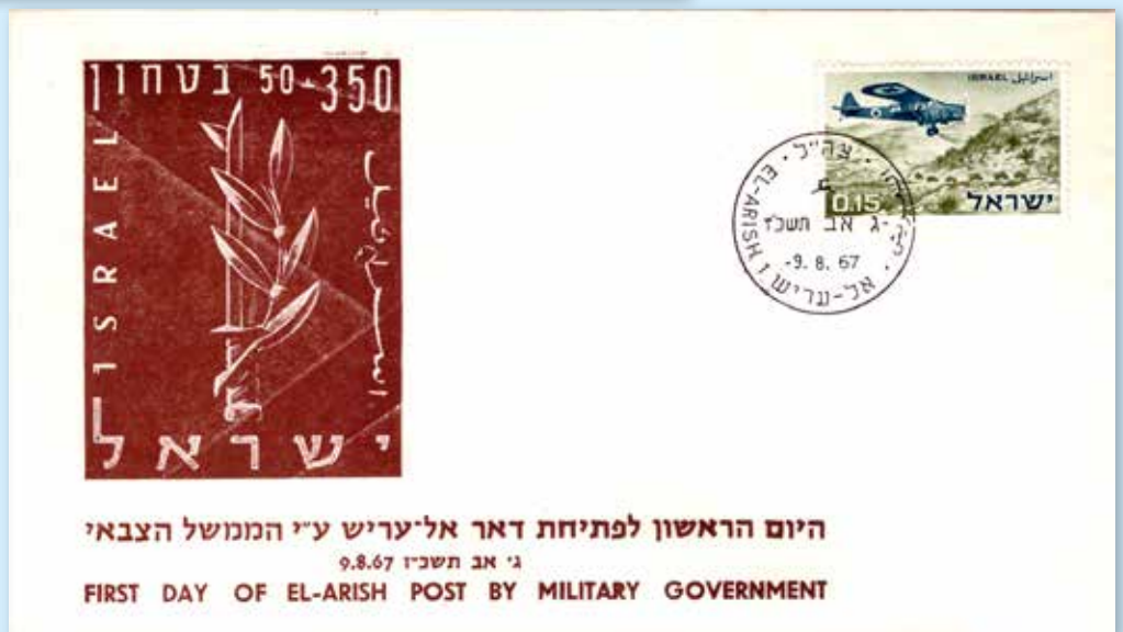
Erinnerungsbrief an die Eröffnung des israelischen Postamts in Es Arish (Sinai) unter militärischer Verwaltung, dreisprachiger Stempel El Arish vom 9. August 1967.