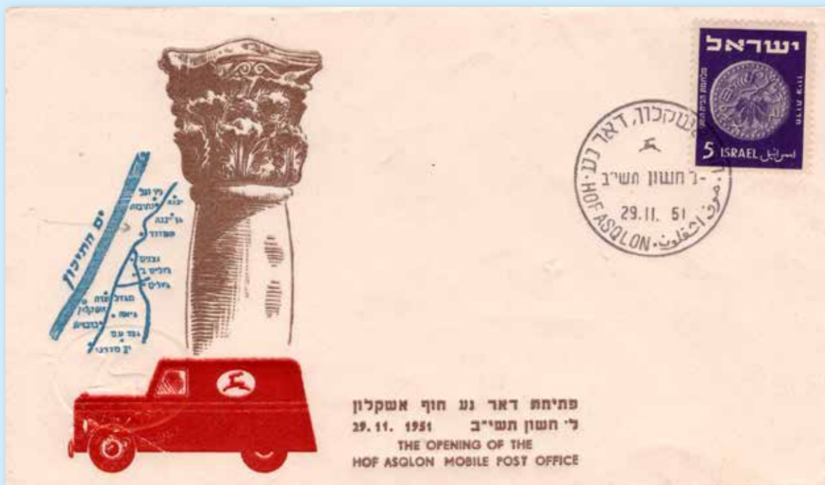
Eröffnung des Mobilpostamts in Hof Asqalon am 29. November 1951. Brief mit Abbildung einer antiken Säule und Mobilpostauto. Dreisprachiger Stempel von Hof Asqalon noch ohne stilisierte Autoabbildung.