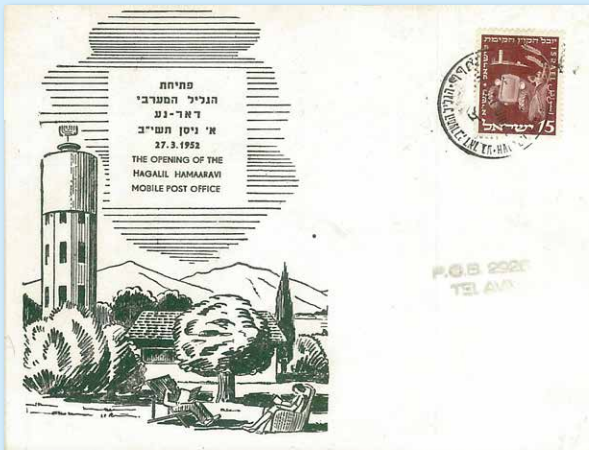
Eröffnung des Mobilpostamts in Hamaaravi (Westgalläa) am 27. März 1952 mit dreisprachigem Stempel Hamaaravi.