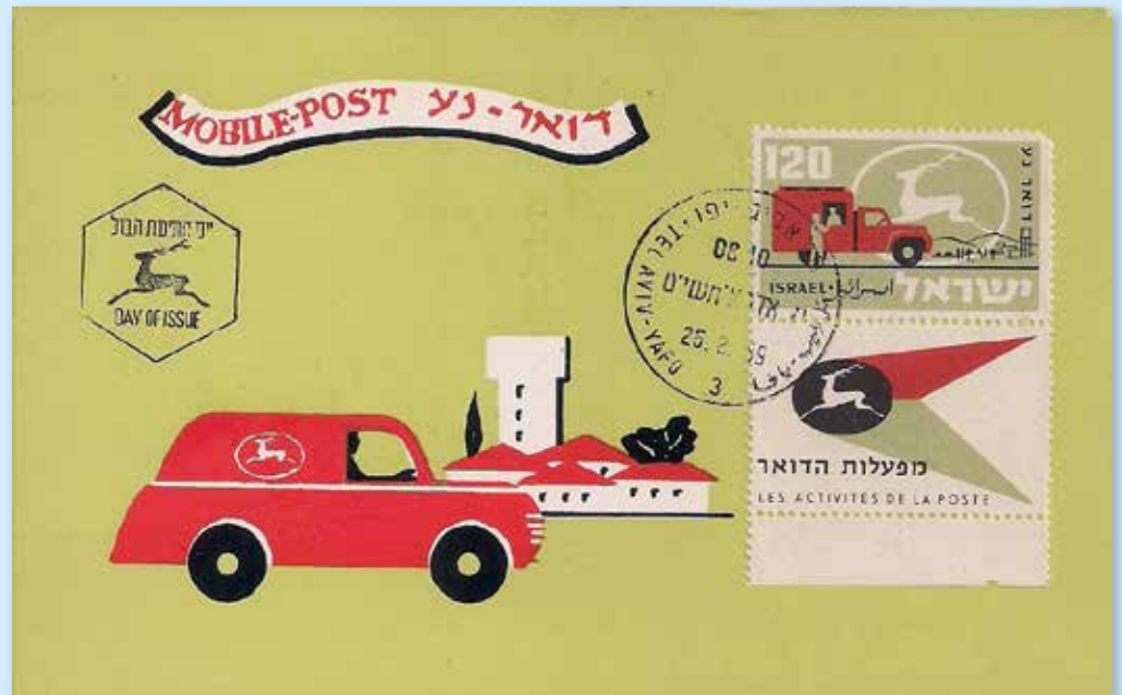
Ersttagsbrief mit der Briefmarke für das Automobilpostamt aus der Serie „10 Jahre Israelische Post“ vom 25. Februar 1959. Dargestellt wird auf der Marke ein Mobilpostwagen mit geöffnetem Schalter und eine dörfliche Landschaft.

Das erste Mobilpostamt nahm seinen Dienst am 28.3.1950 auf. Ende 1960 gab es 29 Ämter, die 515 Siedlungen mit etwa 250.000 Einwohnern versorgten (rund 12 v.H. der Bevölkerung). Die Summe der 29 Kurse beträgt rund 4.000 km. Die in den Kraftwagen instal-