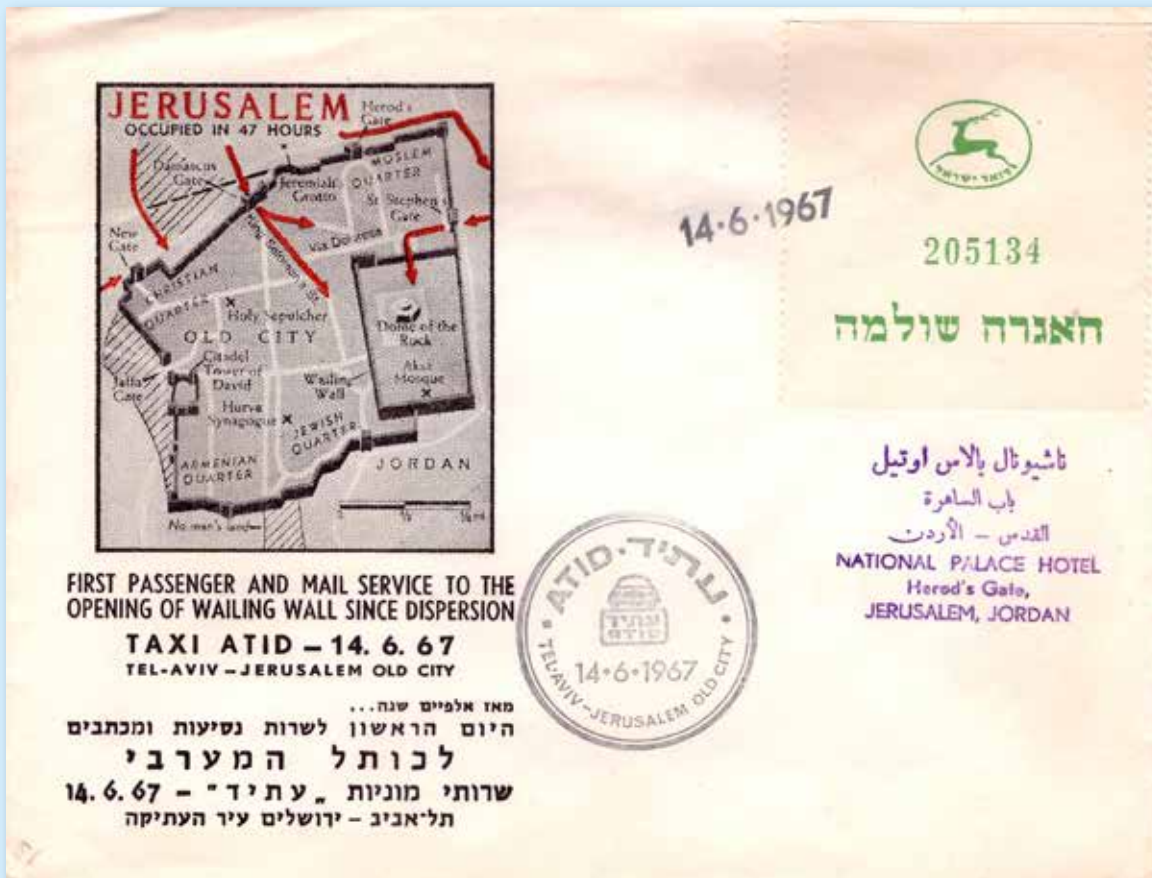
Erste Taxipost und Postservice mit der Privatfirma TAXI ADID ab 14. Juni 1967 in die Altstadt von Jerusalem und an die Klagemauer. Nummeriertes Freimachungs-Etikett der Israel Post, Datumsstempel 14.6.67 und Privatstempel mit Reisedatum. Anschriftstempel des National Palace Hotels in Jerusalem.