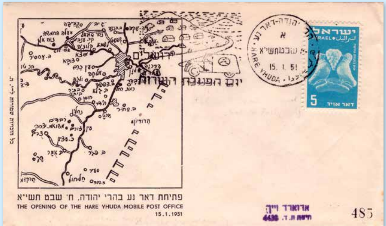
Eröffnung des Mobilpostamts in Hare Yehuda am 15. Januar 1951. Brief mit Landkarte der zu dieser Zeit betriebenen Mobilpostlinien und Sonderstempel Hare Yhuda.