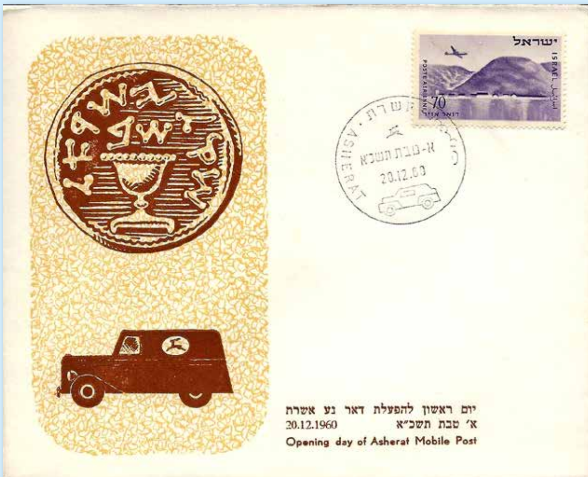
Eröffnung des Mobilpostamts in Asherat am 20. Dezember 1960. Brief mit Abbildung der Münze aus der Doar-Ivri. Briefmarke und Mobilpostauto.

Jedes Mobilpostamt ist mit zwei Bediensteten besetzt, dem Fahrer und dem Schalterbeamten. Die Wagen sind mit Radiotelefon ausgerüstet, so dass Telegramme während der Fahrt aufgeben und annehmen können.