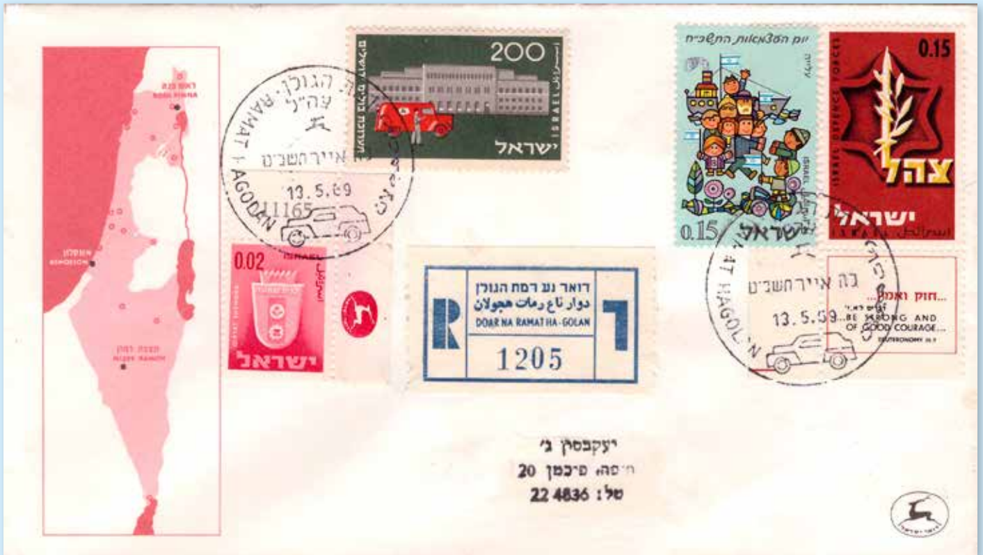
Eingeschriebener Brief mit R-Zettel „Mobile Post Ramat Ha-Golan“ vom 13. Mai 1959. Landkarte Israel mit eingezeichneten Mobilpostämtern. Dreisprachiger Mobilpost-Stempel von Ramat Ha-Golan.