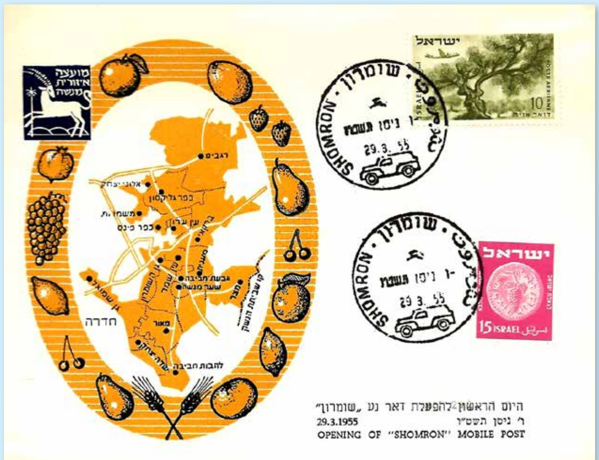
Eröffnung des Mobilpostamts in Shomron am 29. März 1955. Brief mit Abbildung der Früchte des Landes, Wappen und Landkarte des Distrikts. Dreisprachiger Mobilpost-Stempel von Shomron.